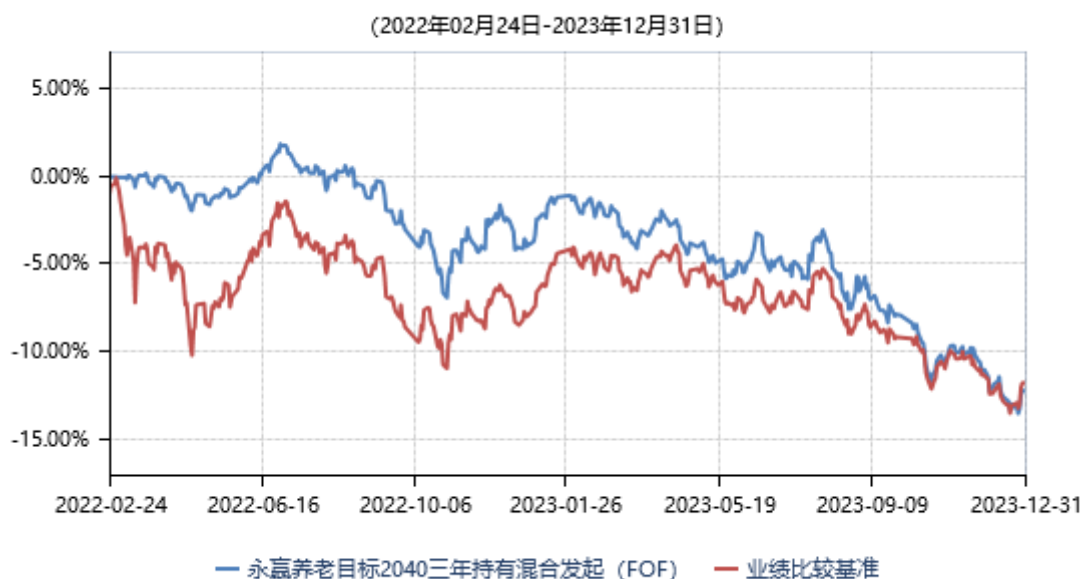
永赢养老目标日期2040三年持有期混合型发起式基金中基金（FOF）累计净值收益率与业绩比较基准收益率历史：