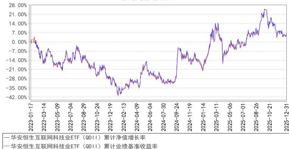
华安恒生互联网科技业ETF (QDII) 累计净值增长率与同期业绩比较基准收益率的历史走势对比图