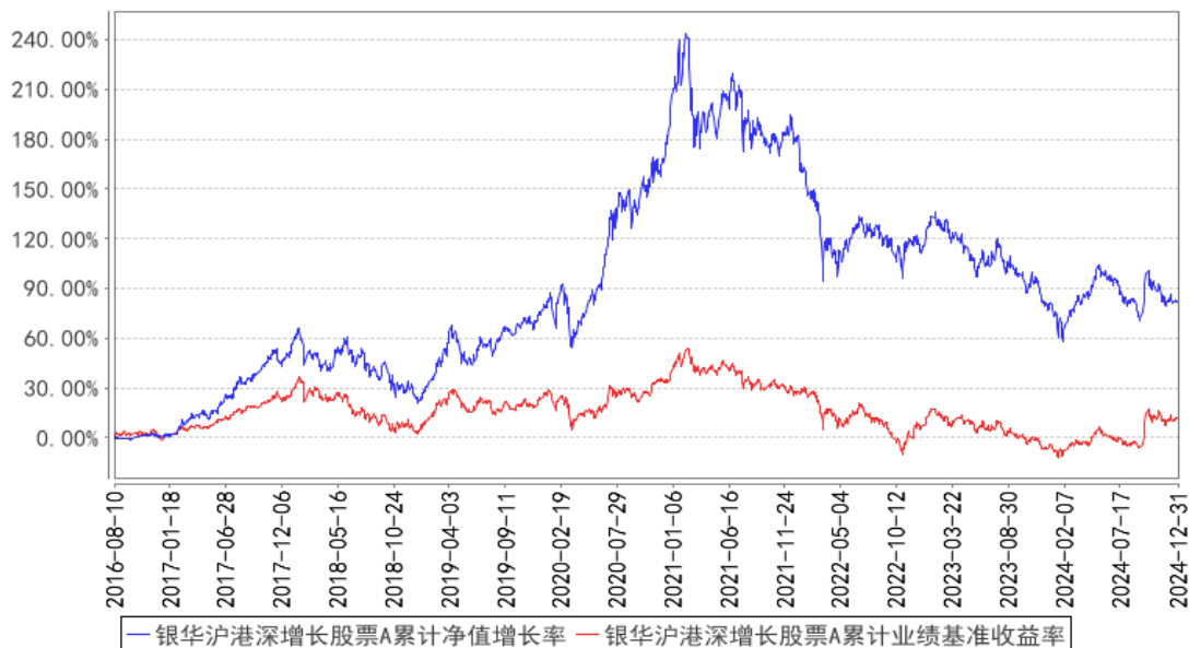
银华沪港深增长股票A累计净值增长率与同期业绩比较基准收益率的历史走势对比图