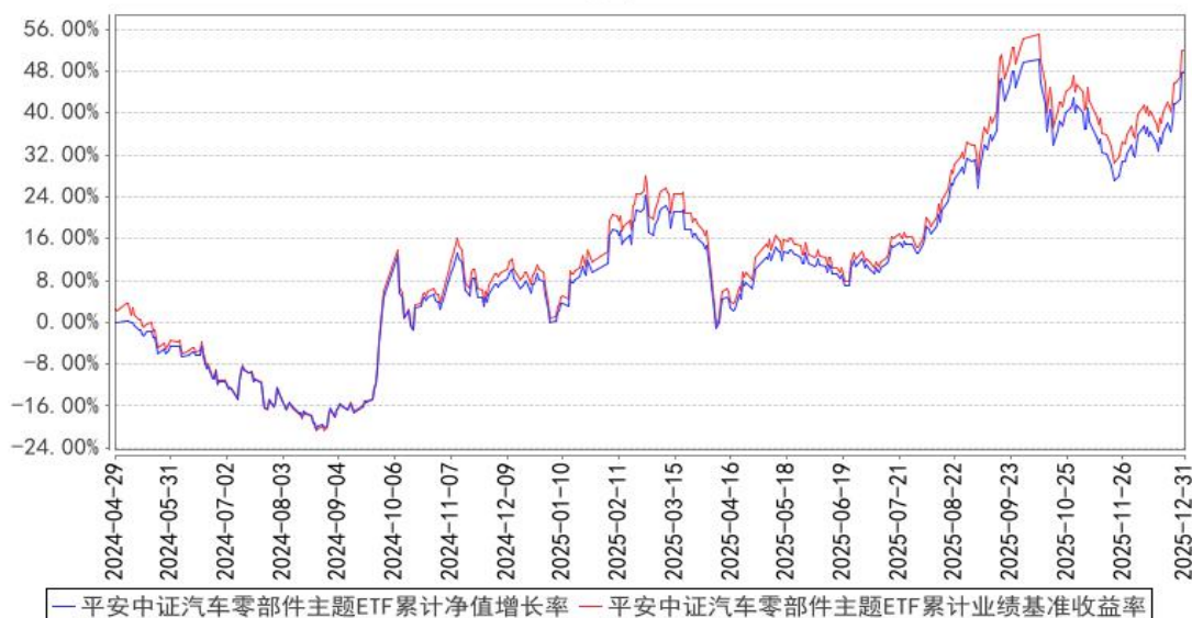
平安中证汽车零部件主题ETF累计净值增长率与同期业绩比较基准收益率的历史走势对比图