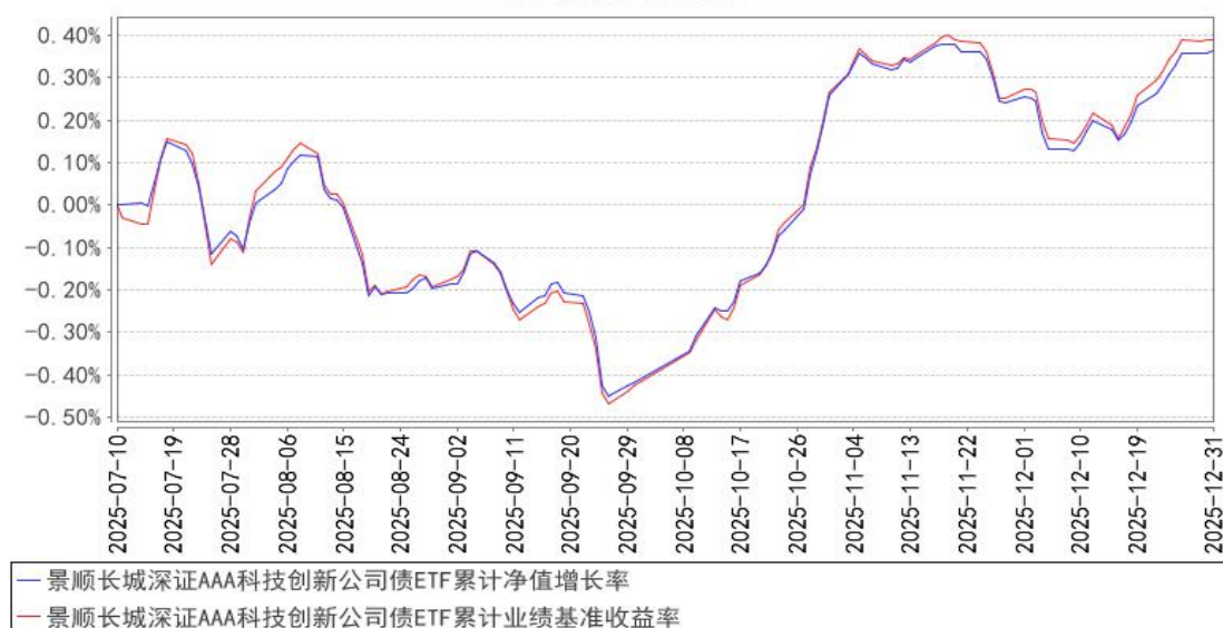
景顺长城深证AAA科技创新公司债ETF累计净值增长率与同期业绩比较基准收益率的历史走势对比图

注：基金的投资组合比例为：本基金投资于债券资产的比例不低于基金资产的 80%；其中投资于标的指数成份债券和备选成份债券的资产比例不低于基金资产净值的 90%，且不低于本基金非现金基金资产的 80%。本基金每个交易日日终在扣除国债期货合约需缴纳的交易保证金后，应当保持不低于交易保证金一倍的现金，其中，现金不包括结算备付金、存出保证金和应收申购款等。本基金的建仓期为自 2025 年 7 月 10 日基金合同生效日起 6 个月。截至本报告期末，本基金仍处于建仓期。基金合同生效日（2025 年 7 月 10 日）起至本报告期末不满一年。