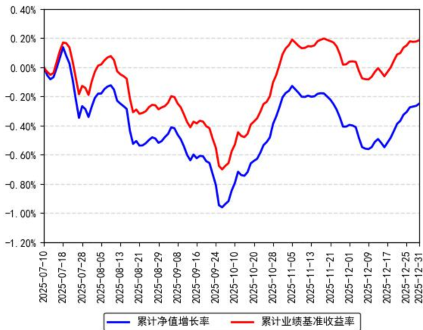
南方中证AAA科技创新公司债ETF累计净值增长率与同期业绩比较基准收益率的历史走势对比图

注：本基金合同于 2025 年 7 月 10 日生效，截至本报告期末基金成立未满一年；自基金成立日起 6 个月内为建仓期，截至报告期末建仓期尚未结束。