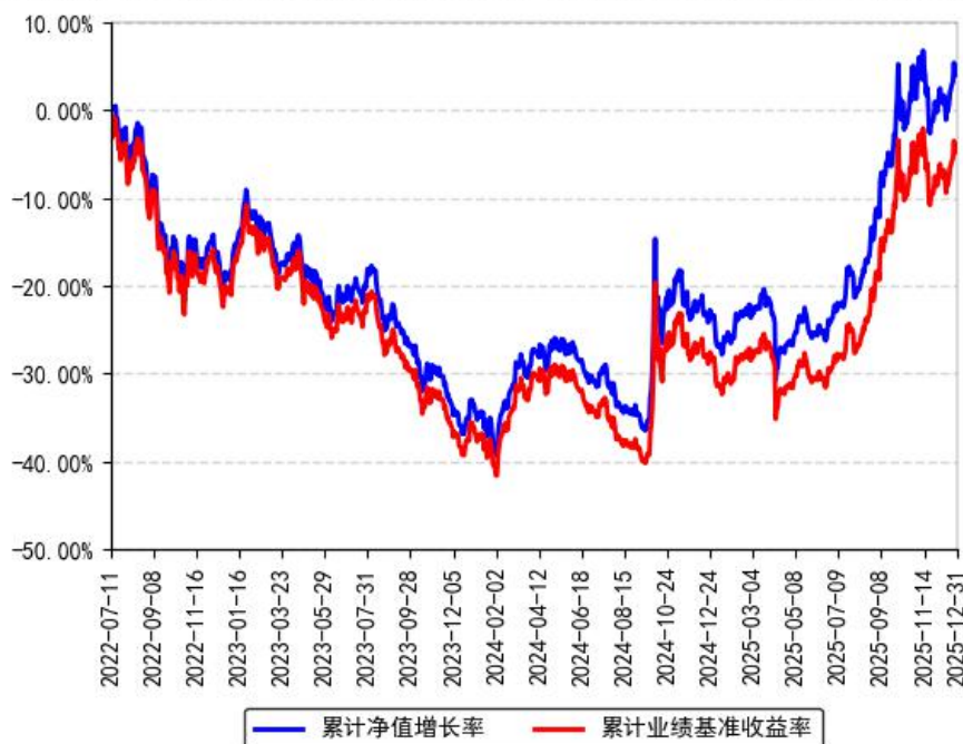
南方中证上海环交所碳中和ETF累计净值增长率与同期业绩比较基准收益率的历史走势对比图