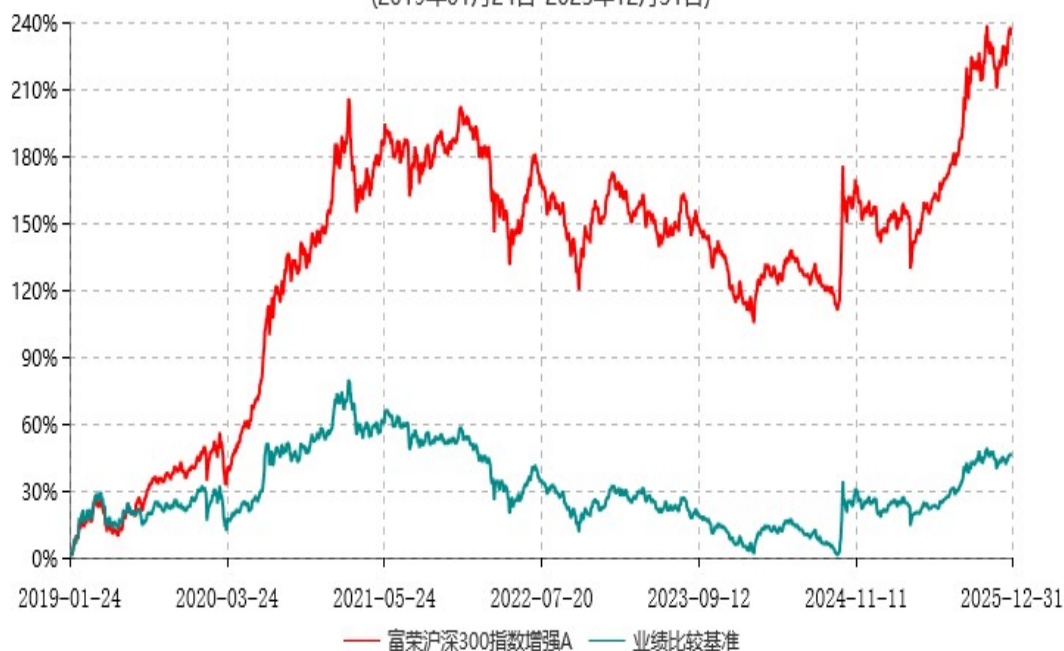
富荣沪深300指数增强C累计净值增长率与业绩比较基准收益率历史走势对比图