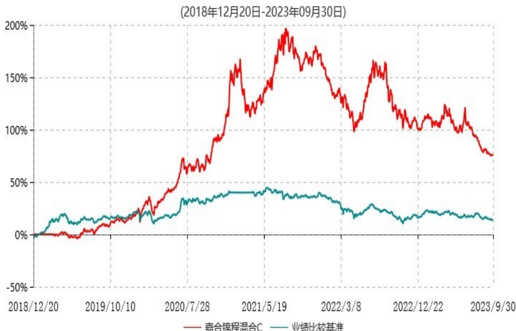
嘉合锦程混合C累计净值增长率与业绩比较基准收益率历史走势对比图