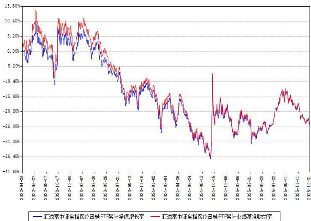
汇添富中证全指医疗器械ETF累计净值增长率与同期业绩比较基准收益率对比图

注：本基金建仓期为本《基金合同》生效之日（2022年04月28日）起6个月，建仓期结束时各项资产配置比例符合合同约定。