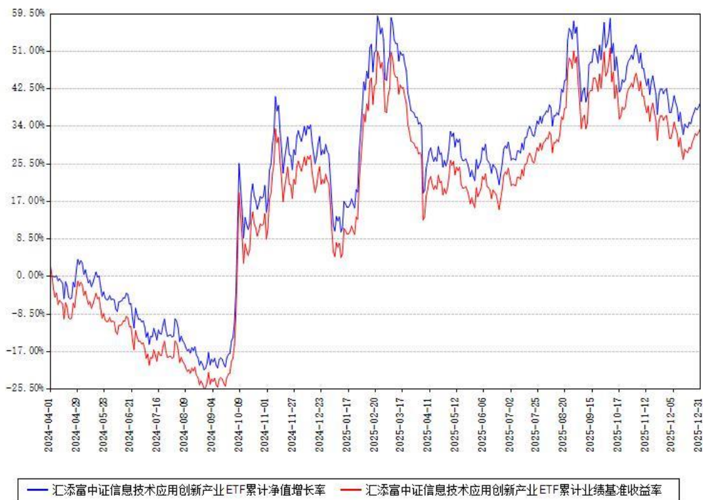
汇添富中证信息技术应用创新产业ETF累计净值增长率与同期业绩基准收益率对比图

注：本基金建仓期为本《基金合同》生效之日（2024年04月01日）起6个月，建仓期结束时各项资产配置比例符合合同约定。