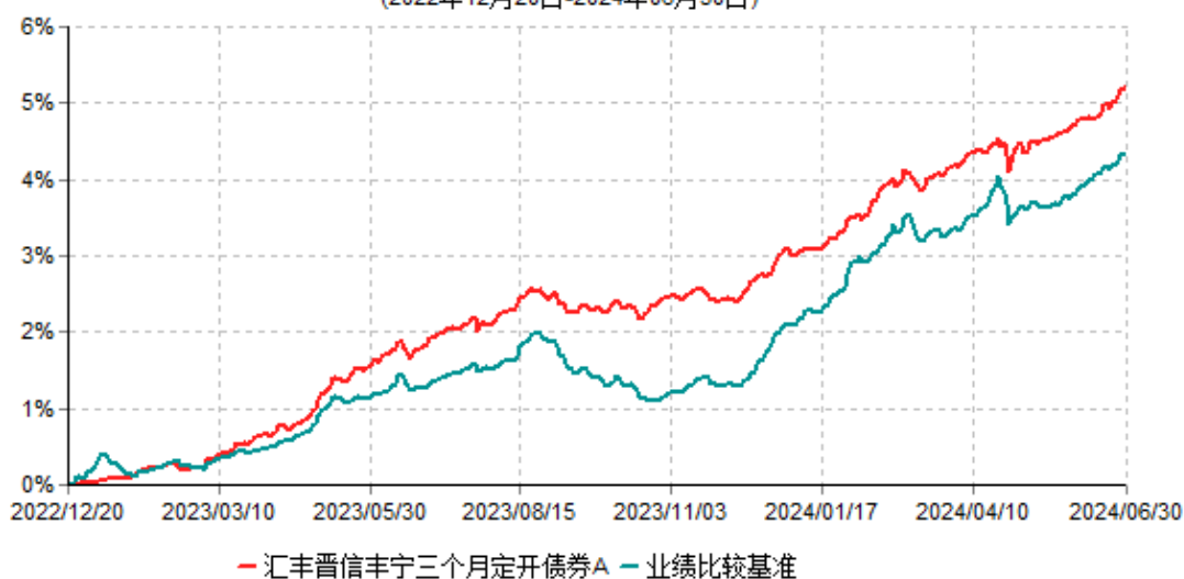
汇丰晋信丰宁三个月定开债券A累计净值增长率与业绩比较基准收益率历史走势对比图 (2022年12月20日-2024年06月30日)