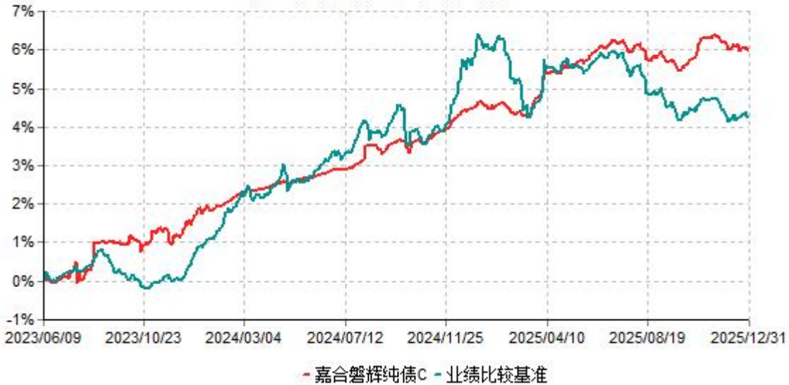
嘉合磐辉纯债C累计净值增长率与业绩比较基准收益率历史走势对比图 (2023年06月09日-2025年12月31日)