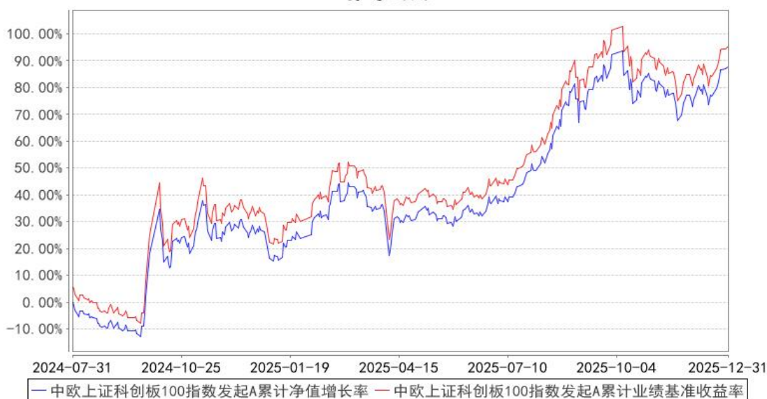
中欧上证科创板100指数发起A累计净值增长率与同期业绩比较基准收益率的历史走势对比图

注：本基金基金合同生效日期为 2024 年 7 月 31 日，按基金合同的规定，本基金自基金合同生效起六个月为建仓期，建仓期结束时各项资产配置比例已经符合基金合同约定。