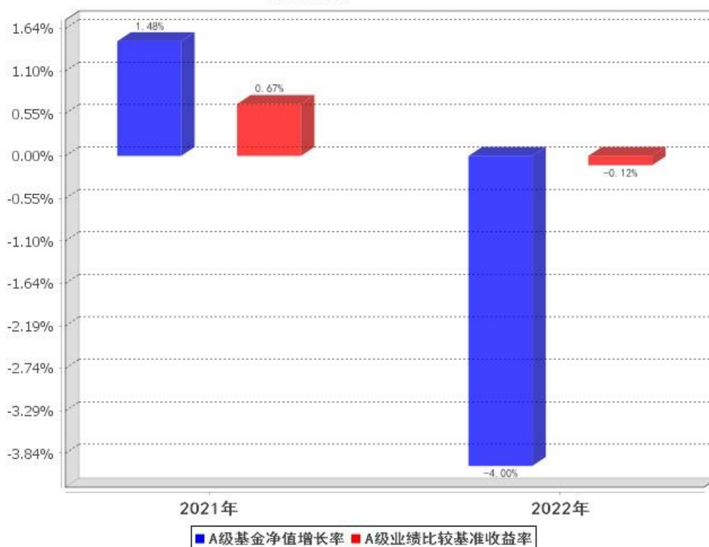
A级自基金合同生效以来基金每年净值增长率及其与同期业绩比较基准收益率的对比图 截止日期: 2022-12-31