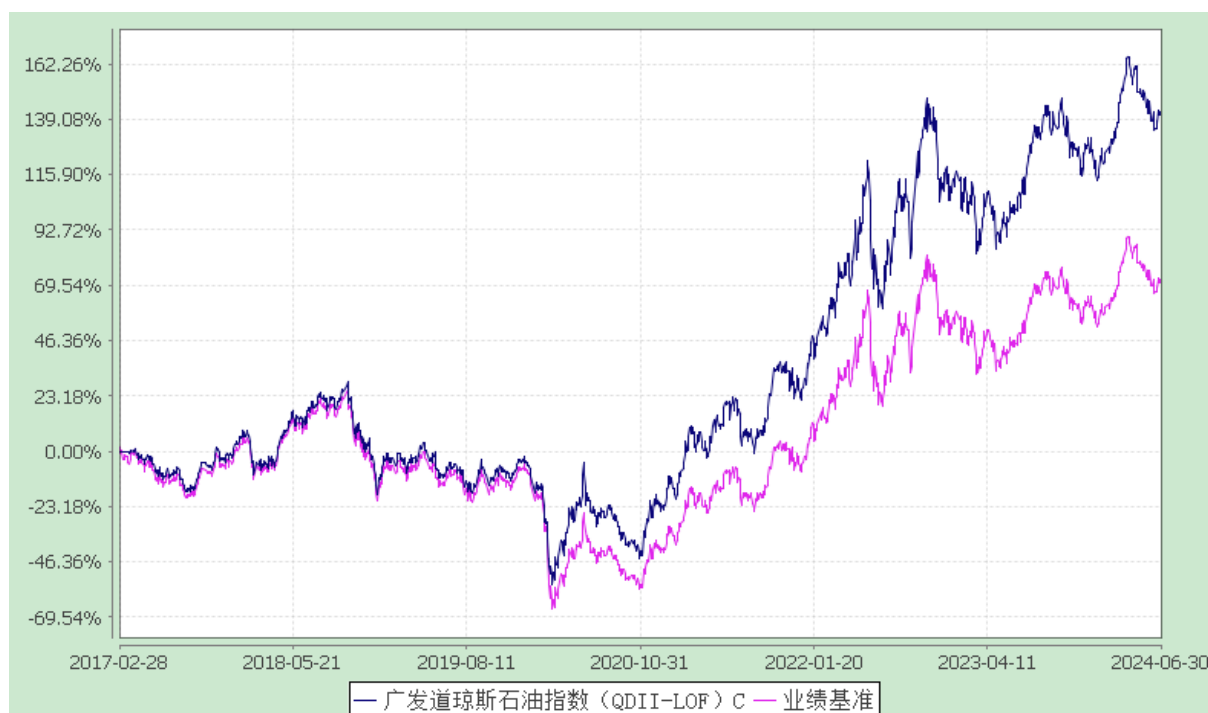
广发道琼斯石油指数（QDII-LOF）E