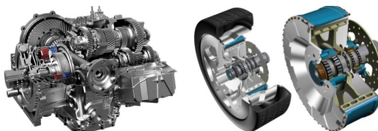
传动系统图（变速箱总成、轮毂驱动电机）