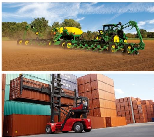
工程机械、农机轴承应用场景图