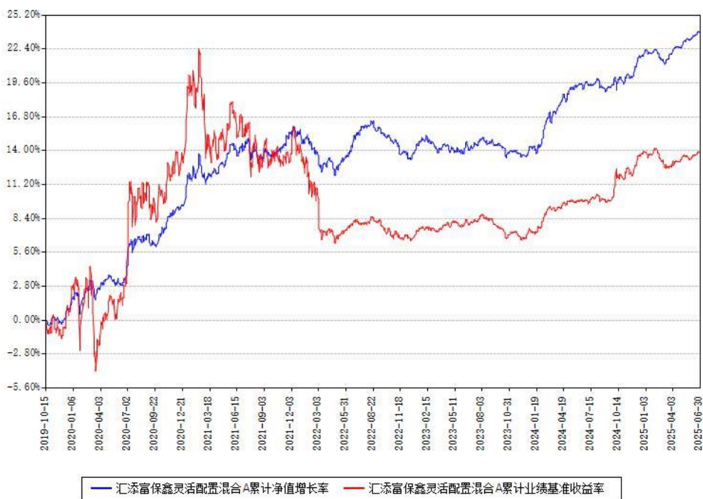
汇添富保鑫灵活配置混合A累计净值增长率与同期业绩基准收益率对比图