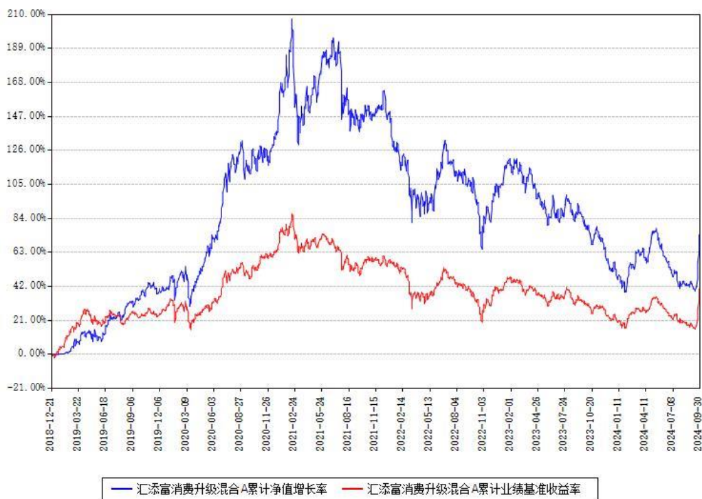
汇添富消费升级混合A累计净值增长率与同期业绩基准收益率对比图

(二)自基金合同生效以来基金累计净值增长率变动及其与同期业绩比较基准收益率变动的比较图