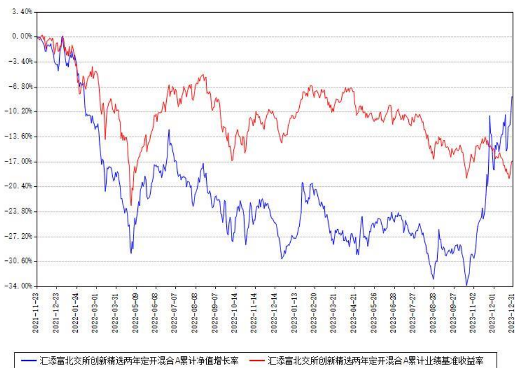
汇添富北交所创新精选两年定开混合A累计净值增长率与同期业绩基准收益率对比图