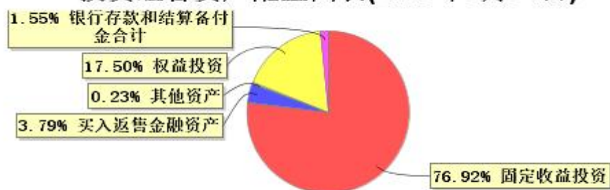
投资组合资产配置图表(2026年3月31日)

● 固定收益投资 ● 买入返售金融资产 ● 其他资产 ● 权益投资 ● 银行存款和结算备付金合计