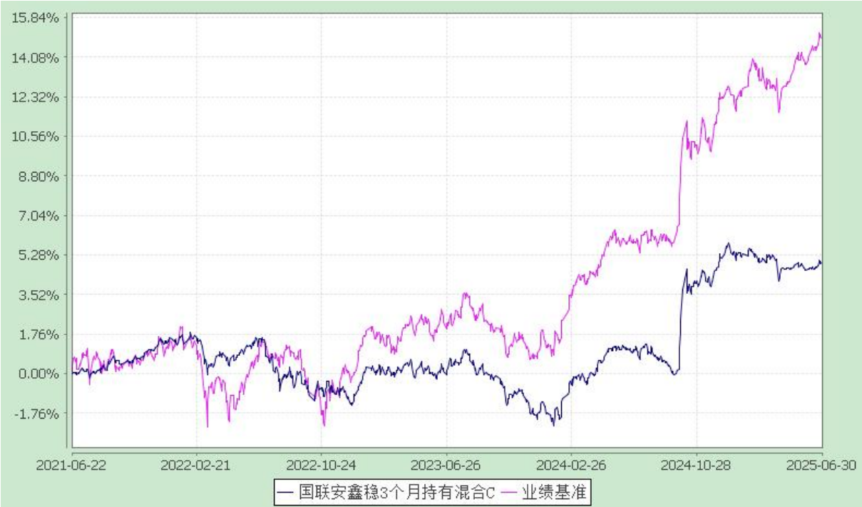
国联安鑫稳 3 个月 C

注：1、本基金业绩比较基准为沪深 300 指数收益率×15%+恒生指数收益率×5%+中证全债指数收益率×80%；