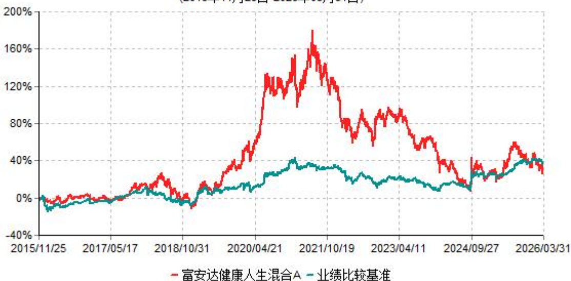
富安达健康人生混合A累计净值增长率与业绩比较基准收益率历史走势对比图 (2015年11月25日-2026年03月31日)