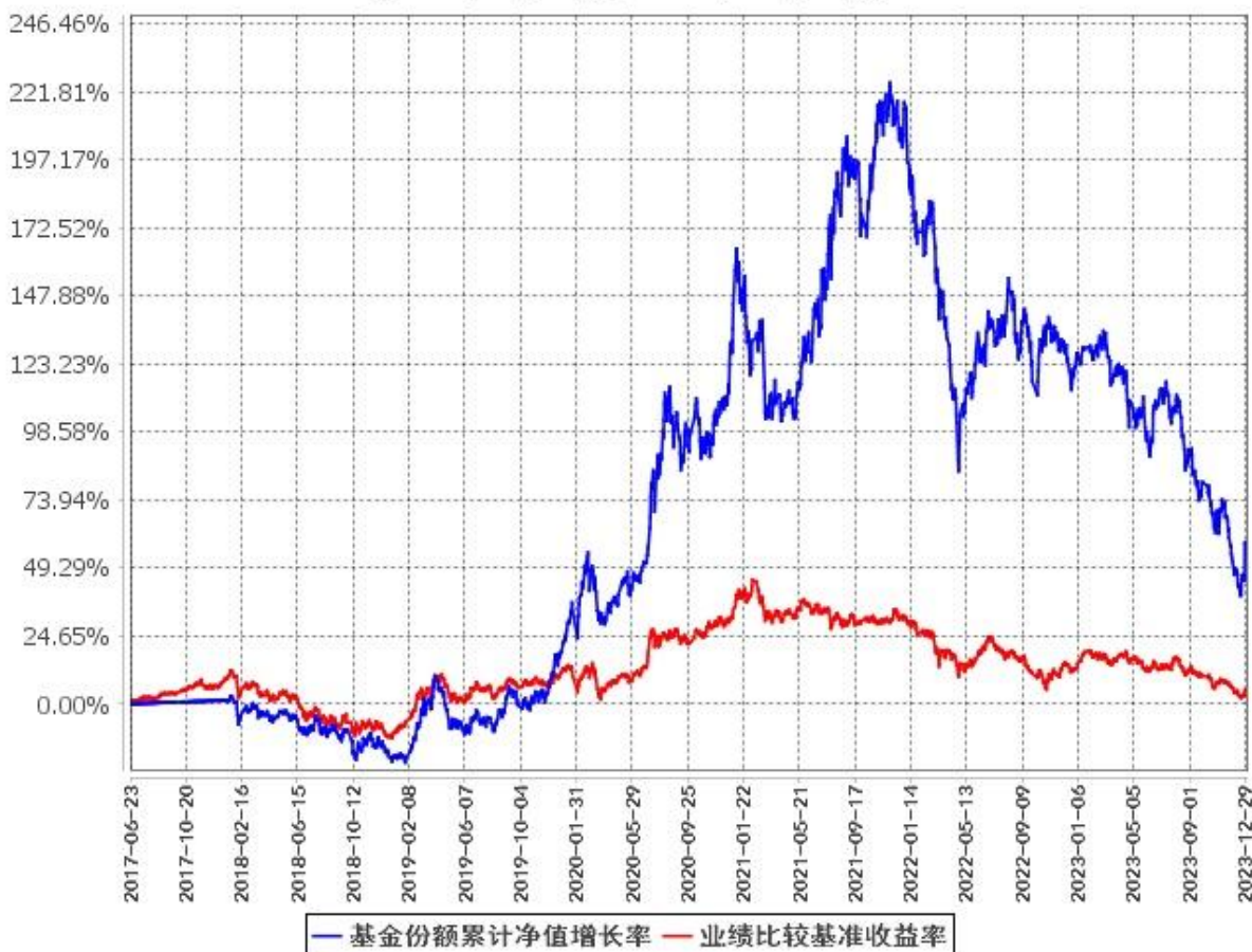
基金份额累计净值增长率与同期业绩比较基准收益率的历史走势对比图 (2017年6月23日至2023年12月31日)