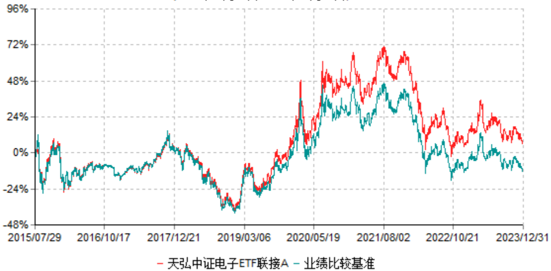
天弘中证电子ETF联接A累计净值增长率与业绩比较基准收益率历史走势对比图 (2015年07月29日-2023年12月31日)