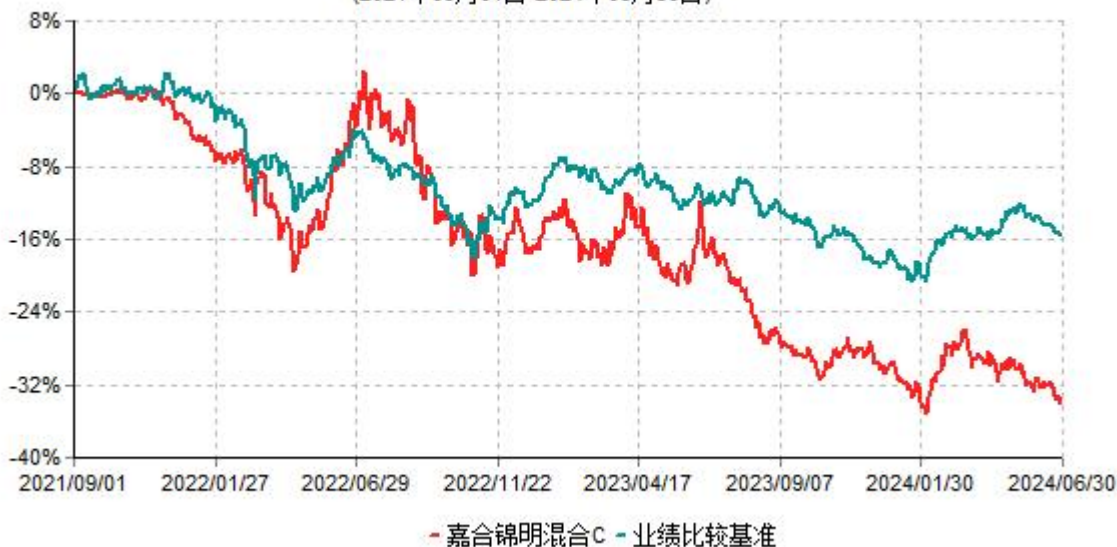
嘉合锦明混合C累计净值增长率与业绩比较基准收益率历史走势对比图 (2021年09月01日-2024年06月30日)