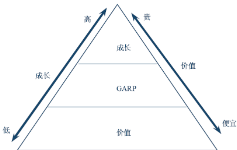
图 1 GARP 投资理念

② 对价值型公司的成长属性进行分析，可以发现相对投资价值较具成长性的股票，在成长潜力释放的过程中获得收益，规避市场价格未合理反映其成长性不足的股票。