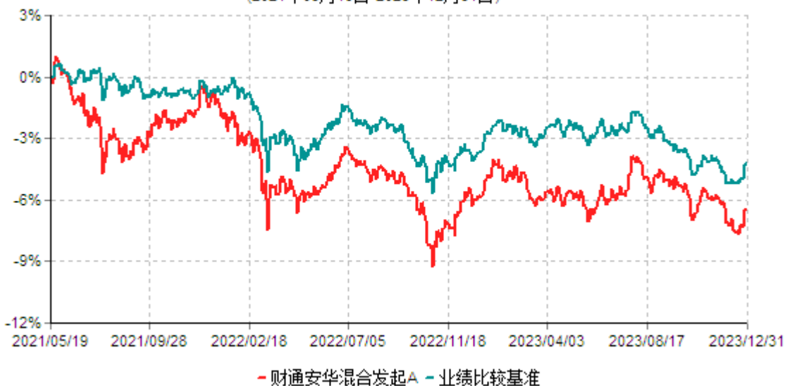
财通安华混合发起A累计净值增长率与业绩比较基准收益率历史走势对比图 (2021年05月19日-2023年12月31日)