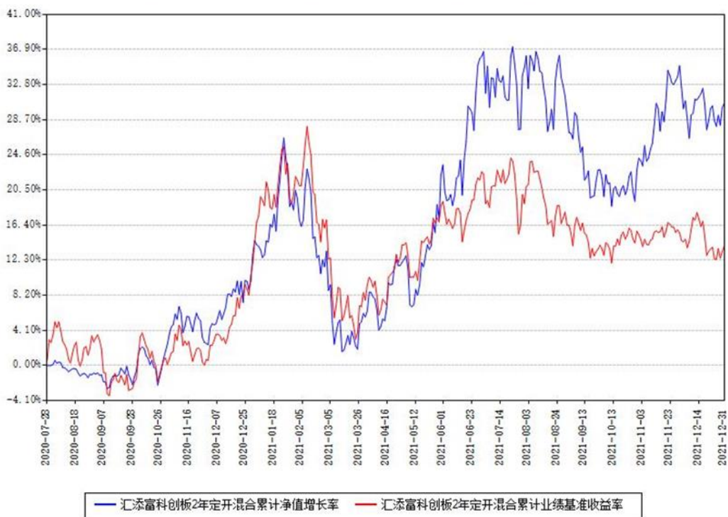
汇添富科创板2年定开混合累计净值增长率与同期业绩基准收益率对比图