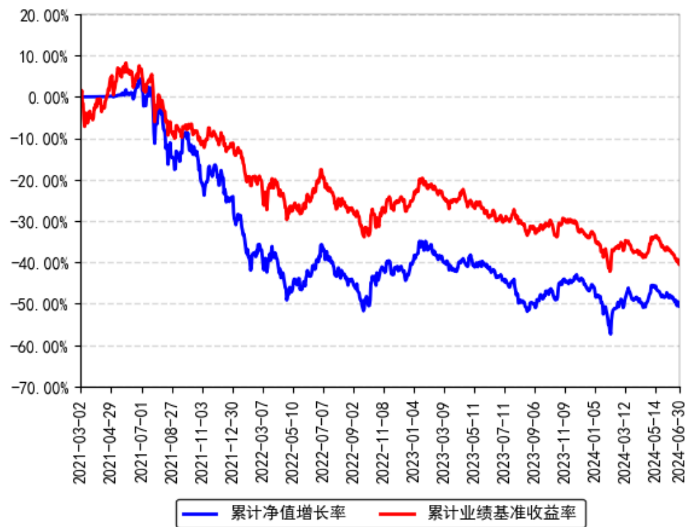
南方医药创新股票A累计净值增长率与同期业绩比较基准收益率的历史走势对比图