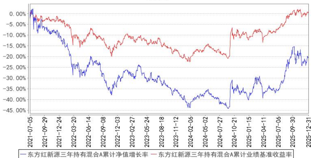
东方红新源三年持有混合A累计净值增长率与同期业绩比较基准收益率的历史走势对比图