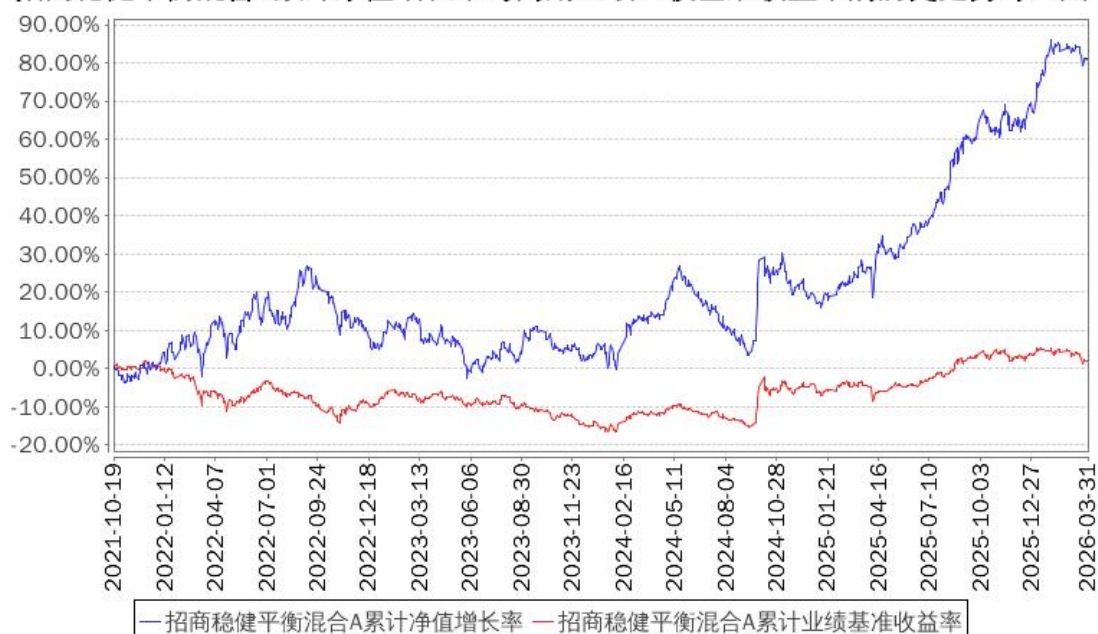
招商稳健平衡混合A累计净值增长率与同期业绩比较基准收益率的历史走势对比图