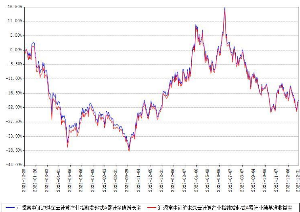
汇添富中证沪港深云计算产业指数发起式A累计净值增长率与同期业绩基准收益率对比图