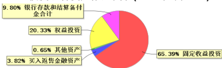
投资组合资产配置图表(2024年6月30日)

● 固定收益投资 ● 买入返售金融资产 ● 其他资产 ● 权益投资 ● 银行存款和结算备付金合计