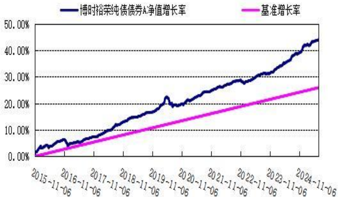
博时裕荣纯债债券 C