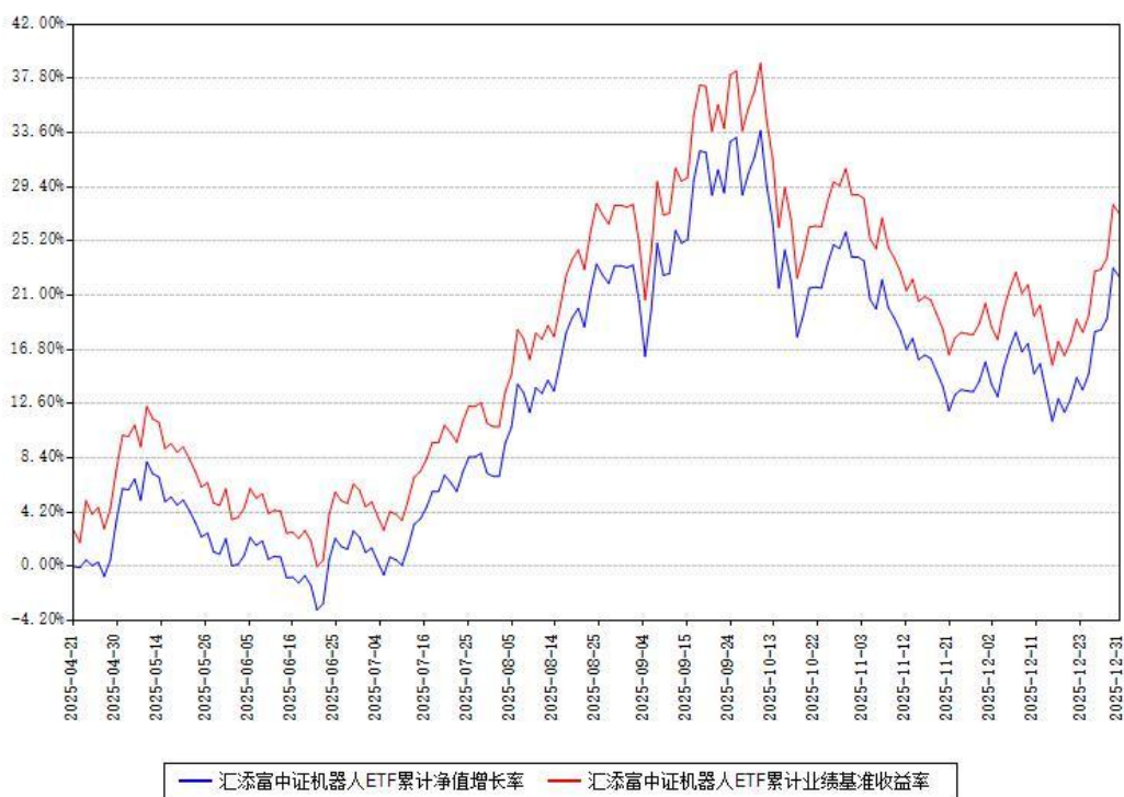
汇添富中证机器人ETF累计净值增长率与同期业绩基准收益率对比图

注：本《基金合同》生效之日为2025年04月21日，截至本报告期末，基金成立未满一年。本基金建仓期为本《基金合同》生效之日起6个月，截至本报告期末，本基金已完成建仓，建仓期结束时各项资产配置比例符合合同约定。