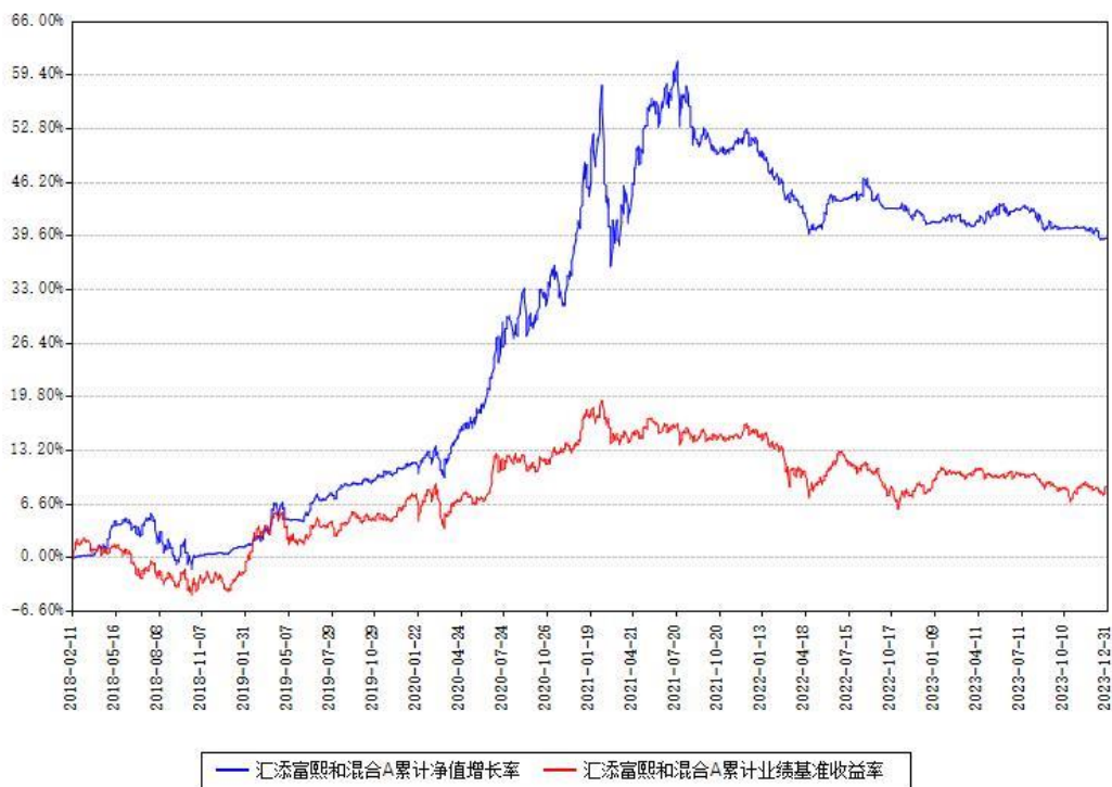
汇添富熙和混合A累计净值增长率与同期业绩比较基准收益率对比图