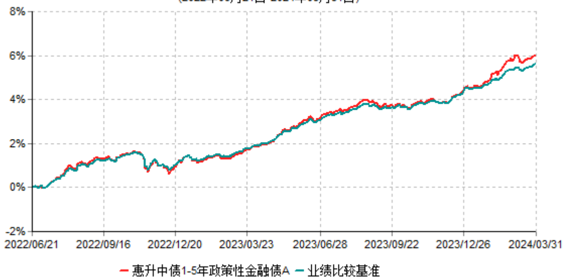
惠升中债1-5年政策性金融债A累计净值增长率与业绩比较基准收益率历史走势对比图 (2022年06月21日-2024年03月31日)