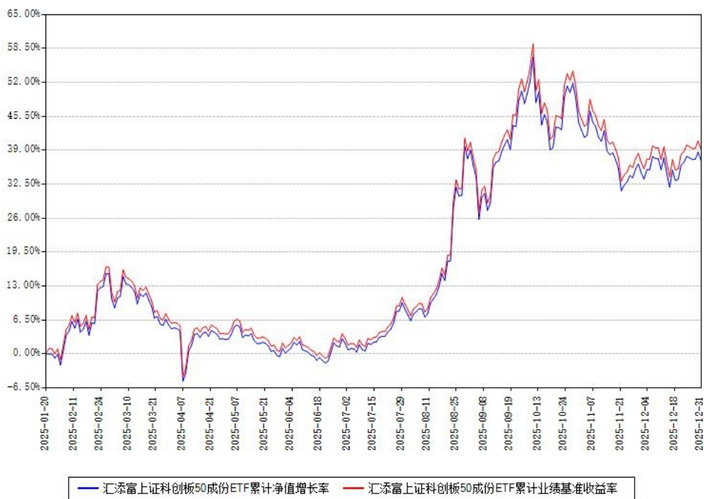
汇添富上证科创板50成份ETF累计净值增长率与同期业绩基准收益率对比图

注：本《基金合同》生效之日为 2025 年 01 月 20 日，截至本报告期末，基金成立未满一年。本基金建仓期为本《基金合同》生效之日起 6 个月，截至本报告期末，本基金已完成建仓，建仓期结束时各项资产配置比例符合合同约定。