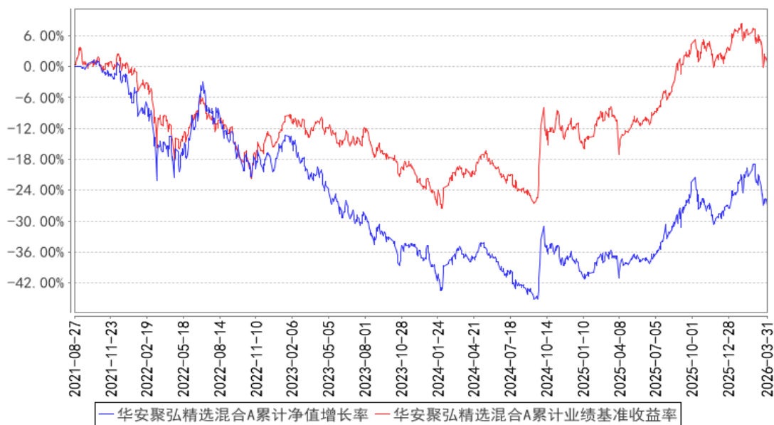
华安聚弘精选混合A累计净值增长率与同期业绩比较基准收益率的历史走势对比图