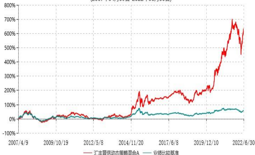
汇丰晋信动态策略混合A累计净值增长率与业绩比较基准收益率历史走势对比图 (2007年04月09日-2022年06月30日)

注：1. 按照基金合同的约定，本基金的投资组合比例为：股票占基金资产的 30%-95%；除股票以外的其他资产占基金资产的 5%-70%，其中现金（不包括结算备付金、存出保证金、应收申购款等）或到期日在一年期以内的政府债券的比例合计不低于基金资产净值的 5%。本基金自基金合同生效日起不超过六个月内完成建仓。截止 2007 年 10 月 9 日，本基金的各项投资比例已达到基金合同约定的比例。