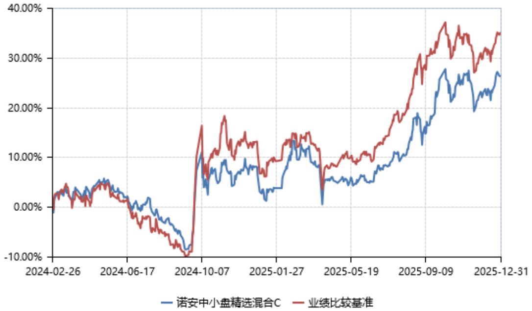
诺安中小盘精选混合 D