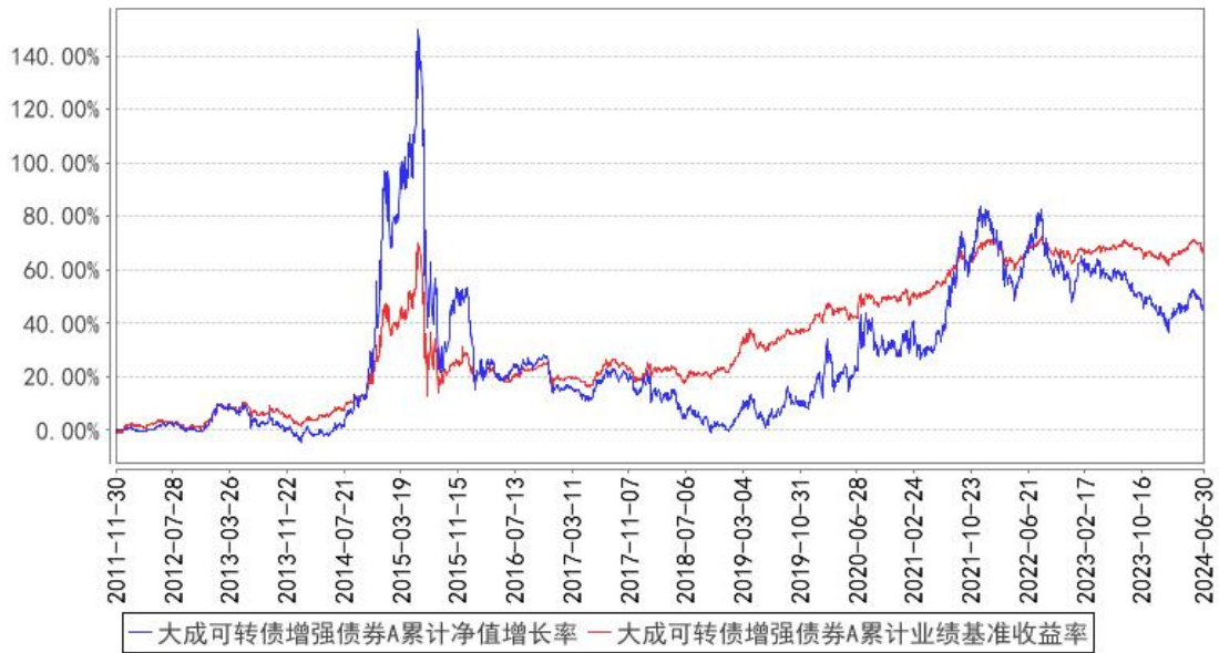
大成可转债增强债券A累计净值增长率与同期业绩比较基准收益率的历史走势对比图

(二) 自基金合同生效以来基金份额累计净值增长率变动及其与同期业绩比较基准收益率变动的比较