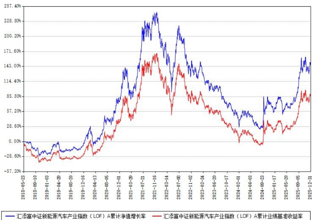
汇添富中证新能源汽车产业指数（LOF）A 累计净值增长率与同期业绩基准收益率对比图