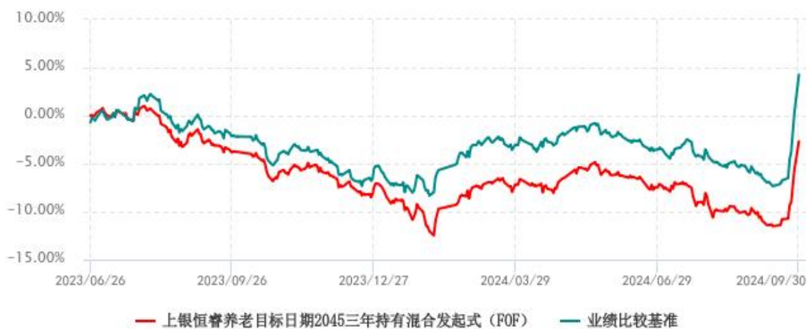
上银恒睿养老目标日期2045三年持有期混合型发起式基金中基金（FOF）累计净值增长率与业绩比较基准收益率历史走势对比图 (2023年06月26日-2024年09月30日)

注：本基金合同生效日为 2023 年 06 月 26 日，自基金合同生效日起 6 个月内为建仓期，建仓期结束时各项资产配置比例符合基金合同约定。