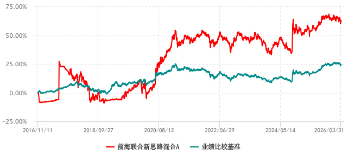
前海联合新思路混合A累计净值增长率与业绩比较基准收益率历史走势对比图 (2016年11月11日-2026年03月31日)