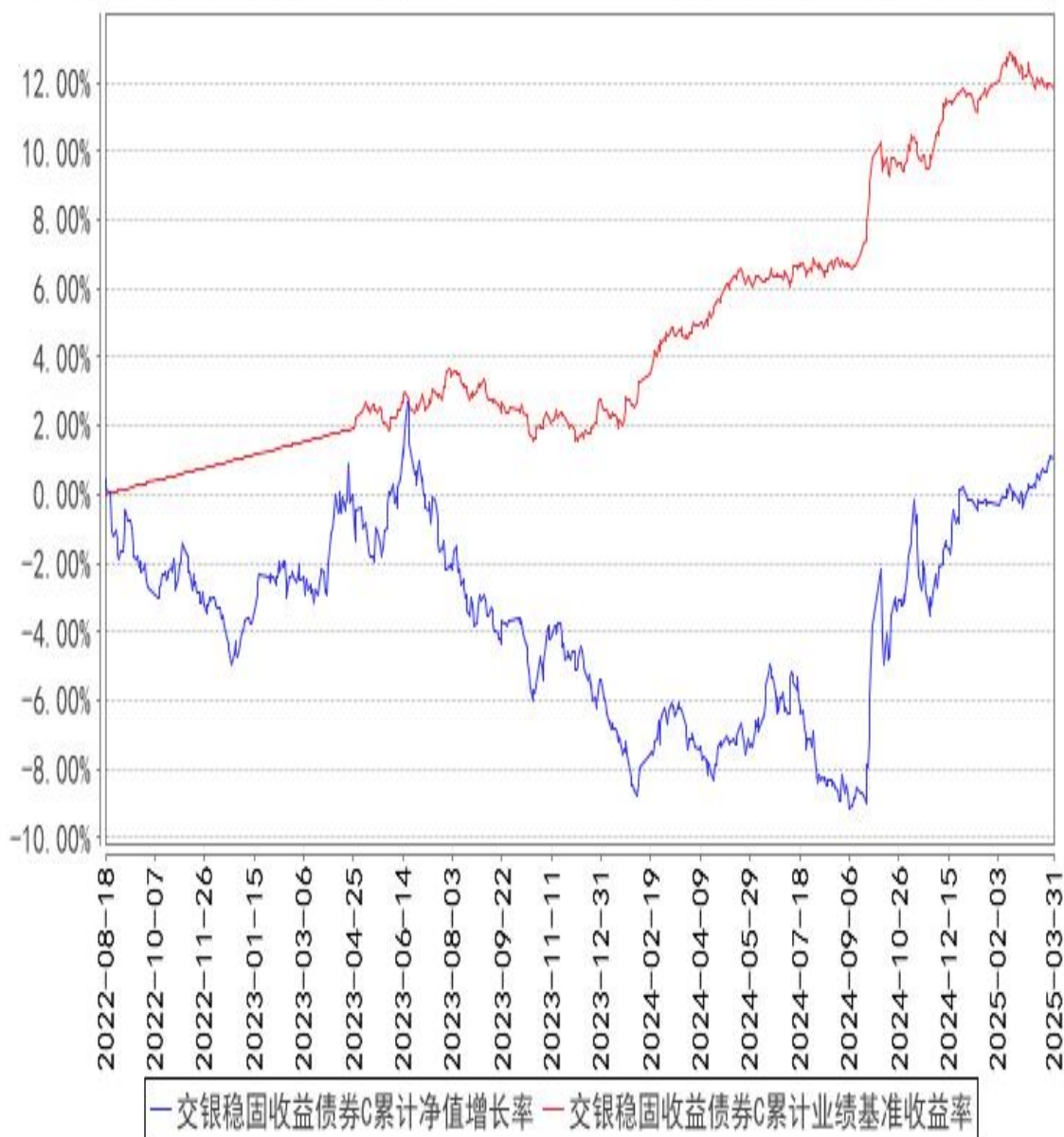
交银稳固收益债券C累计净值增长率与同期业绩比较基准收益率的历史走势对比图

注：1、本基金由交银施罗德荣祥保本混合型证券投资基金转型而来。基金转型日为2019年5月31日。本基金的投资转型期为交银施罗德荣祥保本混合型证券投资基金保本周期到期选择期截止日次日（即2019年5月31日）起的3个月。截至投资转型期结束，本基金各项资产配置比例符合基金合同及招募说明书有关投资比例的约定。