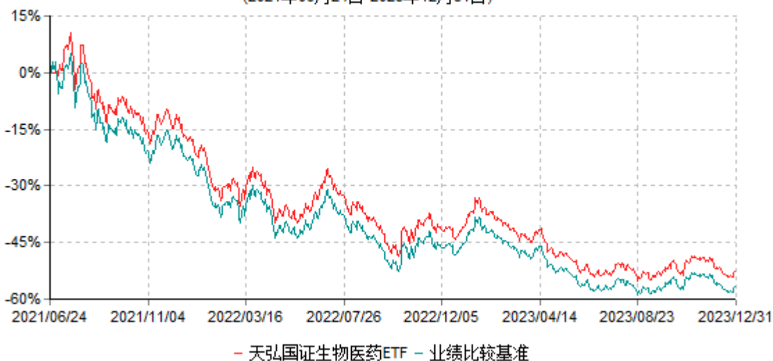
天弘国证生物医药交易型开放式指数证券投资基金累计净值增长率与业绩比较基准收益率历史走势对比图 (2021年06月24日-2023年12月31日)