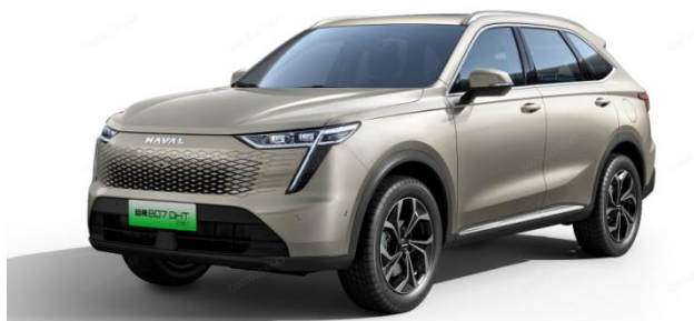
哈弗 枭龙 MAX

哈弗枭龙定位“全能电感潮趣新能源 SUV”，搭载柠檬智能混动 DHT 技术，以哈弗品牌 32 年造车的全能品质为骨架，以未来电感带来的独特体验为灵魂。电感是新能源的外观设计，一眼入心；电感是新能源的驾控感受，一踏启动；电感是智能的用车体验，一语舒享；满足年轻时尚用户对新能源家用 SUV 的所有期待。