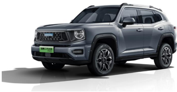
哈弗 二代大狗 PHEV

定位于“3/4 刻度潮野座驾”的哈弗二代大狗，将“狗品类轻越野基因”与“DHT 新能源种族技能”融合统一，“可城、可野、可电”很好地满足了用户对轻越野的美好想象，带来全新的“5+2+e”自在潮野车生活。