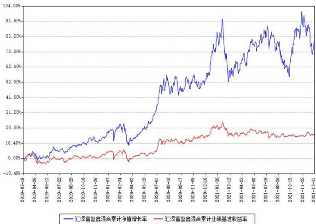
汇添富盈鑫混合累计净值增长率与同期业绩基准收益率对比图